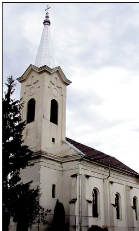
Assiszi Szent Ferenc sebhelyei templom